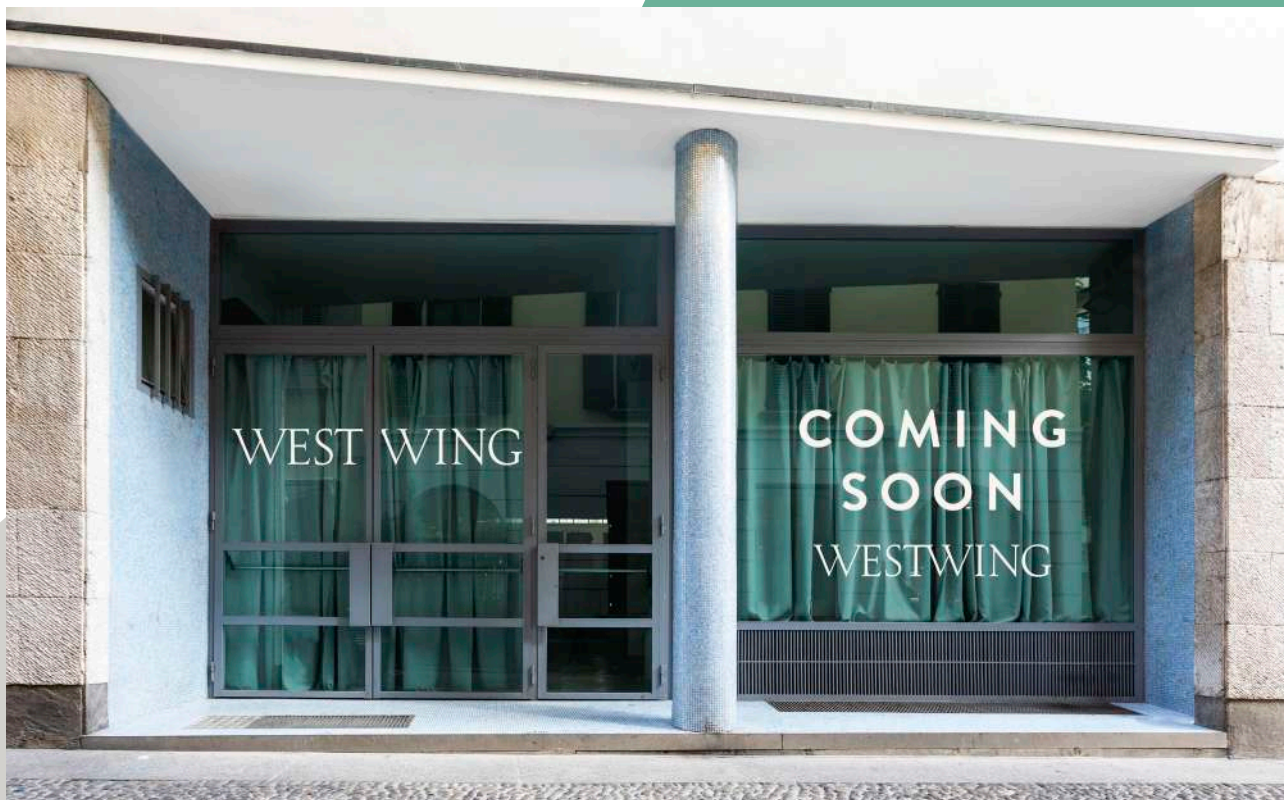
Fronte Pop-up Store Westwing, via San Carpoforo n.9, Milano