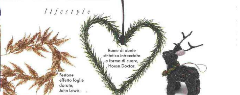
Rame di abete sintetico intrecciato a forma di cuore, House Doctor.