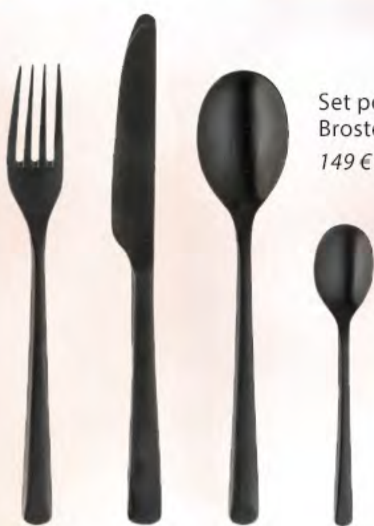
Set posate Hune, 16 pz., Broste Copenhagen 149 € su Westwingnow.it