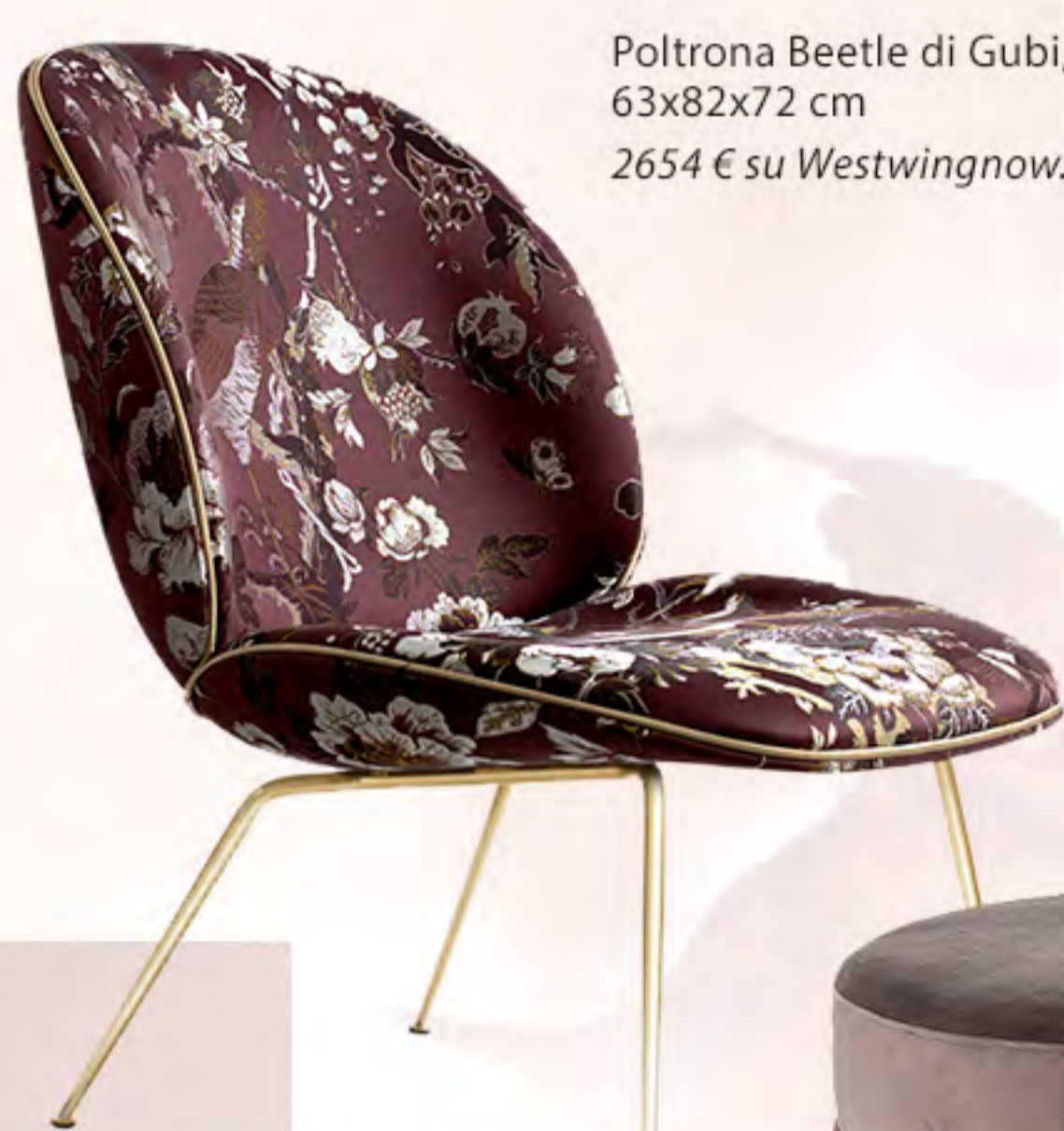
Poltrona Beetle di Gubi, 63x82x72 cm 2654 € su Westwingnow.it