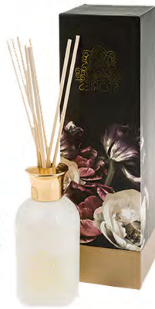
Diffusore Blume & Stories di Eightmood, 9x28 cm 32 € su Westwingnow.it