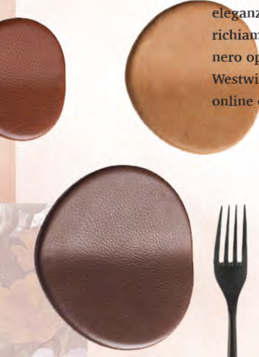
Set ganci da parete Imago di Mater, 3 pz. 129 € su Westwingnow.it

Tonalità calde e avvolgenti, superfici matt che vestono di eleganza accessori e complementi per la tavola, frange e richiami Seventies su arredi e luci. Dalle nuance caramello al nero opaco, ai fiori vintage con grandi fantasie su sfondi scuri, Westwing presenta i nuovi trend per l'autunno nel suo negozio online con prodotti sempre disponibili Westwingnow.it .